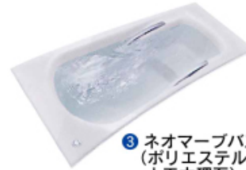
③ ネオマーブバス (ポリエステル系人工大理石) ワンタッチ排水栓 ハンドグリップ付