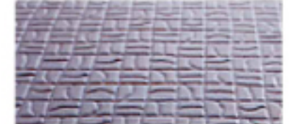
④ カラリ床 翌朝にはくつ下のまま入れます