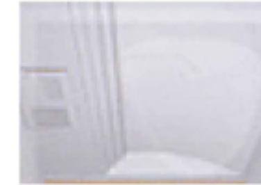
① アーチ天井(断熱仕様)