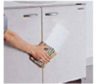
水ハネや汚れに強い ホーロー製