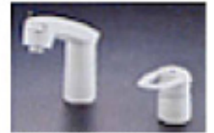
シングルレバー式 シャワー水栓